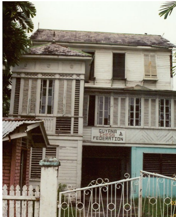
6) Pleds löfik Gvayänanas binons cög e dominov.